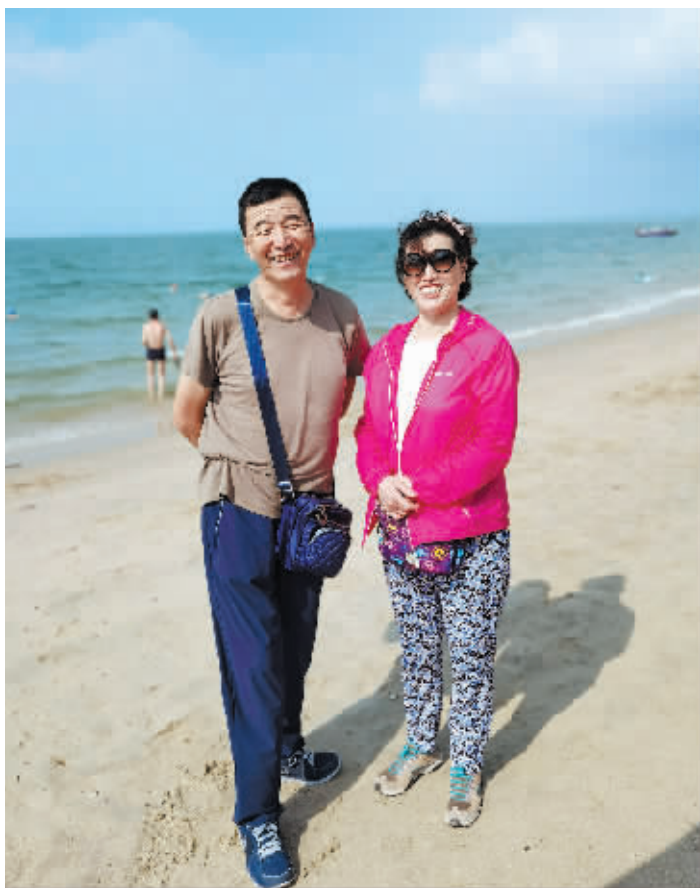
正在三亚过冬的老刘夫妻俩。

七年前，老刘患上了心脑血管疾病，虽抢救及时但也留下了后遗症。为了让老刘养好病，他们在三亚买了房子。这样，每年十月以后，老刘便和老伴儿来到三亚过冬。到了三亚，在老伴儿的悉心照料下，老刘一边康复一边游玩儿。老刘的身体状况一天天好转，等第三年到三亚康复时，他便可以自己遛弯并能帮助妻子买菜做饭了，三亚的多处景点都留下了他们幸福快乐的身影。每年在去三亚的途中，他们依旧是走走停停，一路游览各地风光。老刘说，往后余生，他依旧会和老伴儿一起游玩儿，因为老伴儿是他最好的玩伴儿。