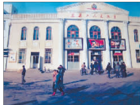
20世纪80年代哈尔滨建筑工人文化宫。

在20世纪60年代，哈尔滨建筑工人文化宫是原动力区唯一的一家公共影剧院，服务对象是动力区30多万产业职工及家属。在我国20世纪七八十年代，国内外优秀影片一部接一部地在建筑工人文化宫上演，极大地丰