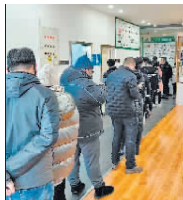
购车市民排队交款。

哈尔滨长青博实汽车销售服务有限公司也是“大丰收”。昨日中午,王经理告诉记者:“今天广本、三菱、传祺三个品牌