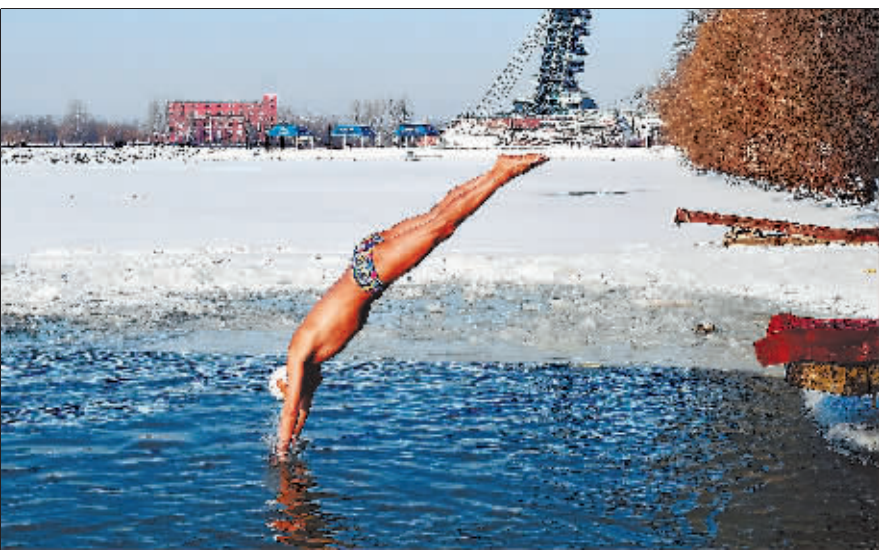
封江不久，哈市冬泳爱好者在松花江畔开凿冬泳池，尽享冬泳乐趣。

■生活习性：家鹅经人工驯化选择后，耐寒性增强，但翅膀退化、飞行能力减弱，不能长距离飞行，不进行越冬迁徙；天鹅常在秋冬季进行长距离迁徙，飞行高度较高，列队呈“一”字或“人”字形，结伴成群飞到温暖的南方越冬地寻找食物，春夏季再返回北方繁殖地。