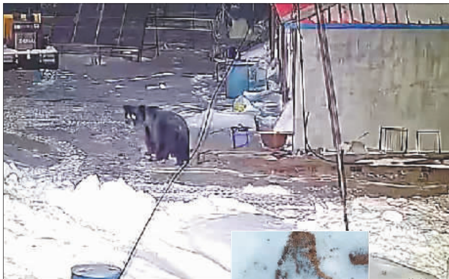
监控 拍下了大 黑熊夜闯 民宅的图 像。