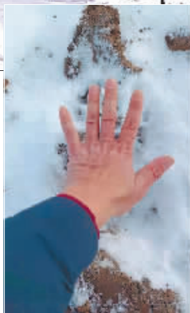
黑熊 留下的脚 印比人的 手还大。

大雪封山,原有食物被雪掩盖,黑熊过冬 要冬眠,很可能是由于为了觅食、储存能 量,这才下山“溜达溜达”。“熊出没”也说 明现在生态环境越来越好。