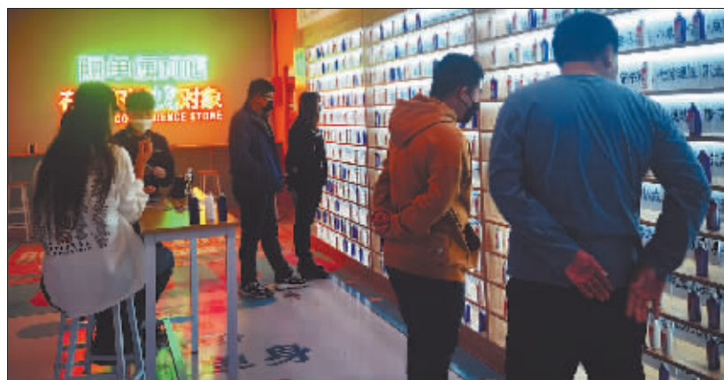
单身男女青年根据自己的需要选择脱单胶囊。

“脱单便利店”虽然是一种比较轻松结交异性的方式,但也存在一定风险,在每一张“脱单小纸条”的背面都印着相关法律法规说明,进行风险提示。老板薛先生表示,“单身便利店”是为都市年轻人提供一个结交朋友的平台,让大家有更多机会结识异性,但“脱单请珍惜,交友须谨慎”。