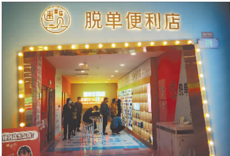
“脱单便利店”为冰城单身男女提供交友新途径。

又想搞对象,又不想被父母安排相亲,那么,花29.9元去“便利店”“买”一个对象,你觉得这事靠谱不?哈尔滨最近开了家“脱单便利店”,专门“卖”单身的小哥哥、小姐姐的资料,开架售货,品种齐全,就跟便利店是一样一样的。开张不到一个月,有300多名哈尔滨单身男女来“买对象”。