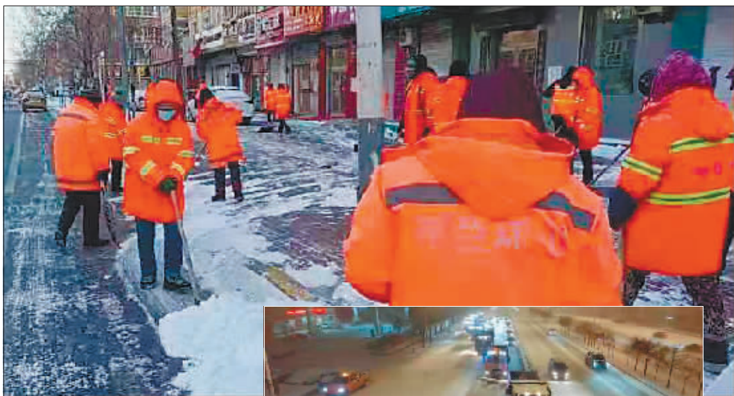
推进背街背巷、居民庭院的清理工作,确保清雪时效,全力保障居民出行顺畅。

目前各作业单位正进一步开展精细化作业,加快积雪清运速度,组织人员对人行道、边石根等加细清理,坚持做到清根见底,确保路面的干净整洁。同时,发动临街单位、物业单位同步