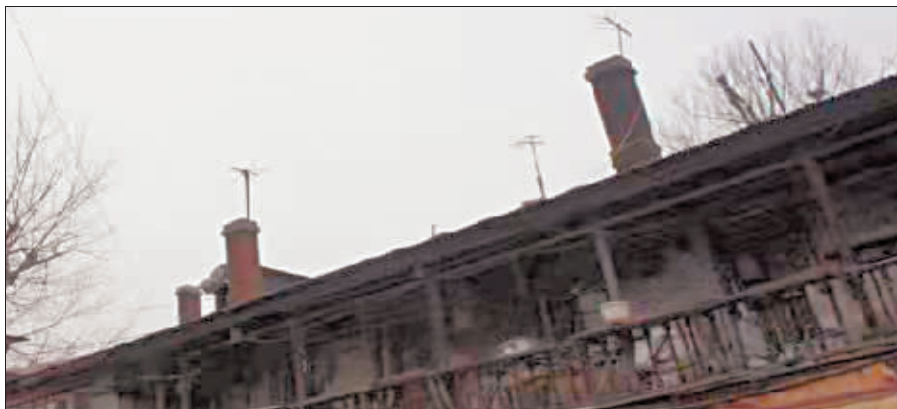
20世纪80年代楼房上的电视天线。