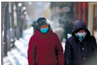
呵气成霜。昨天气温走低,

19日多云,白天最高气温升至-8℃,夜间最低气温-15℃。近日气温波动较大,防疫人员及公众外出请注意增添衣服,避免感冒等呼吸道疾病发生。