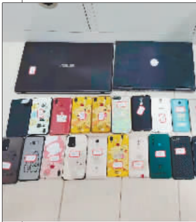
警方缴获的作案手机。

市民要提升防范意识,一是要注意甄别网络各种客服的推广宣传信息,宣称高投资、高回报的项目更要警惕。二是求职要通过正规途径,不要被小利吸引,成为网络犯罪活动的帮凶。