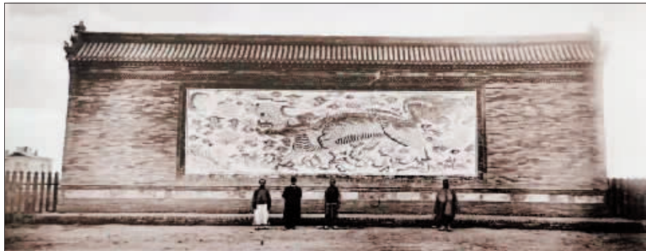
1907年滨江关道内的照壁。

施肇基是哈尔滨历史上第一位博士官员，百余年前，在哈尔滨担任道台短短两年多的时间里，为维护国家主权，他多次代表中国政府与中东铁路局进行交涉，抗议俄国人在中东铁路附属地沿线非法课税；作为一方官员，他为当地百姓护好一方平安；他极为老练地处理伊藤博文案，更是助力伍连德成功地消灭鼠疫。