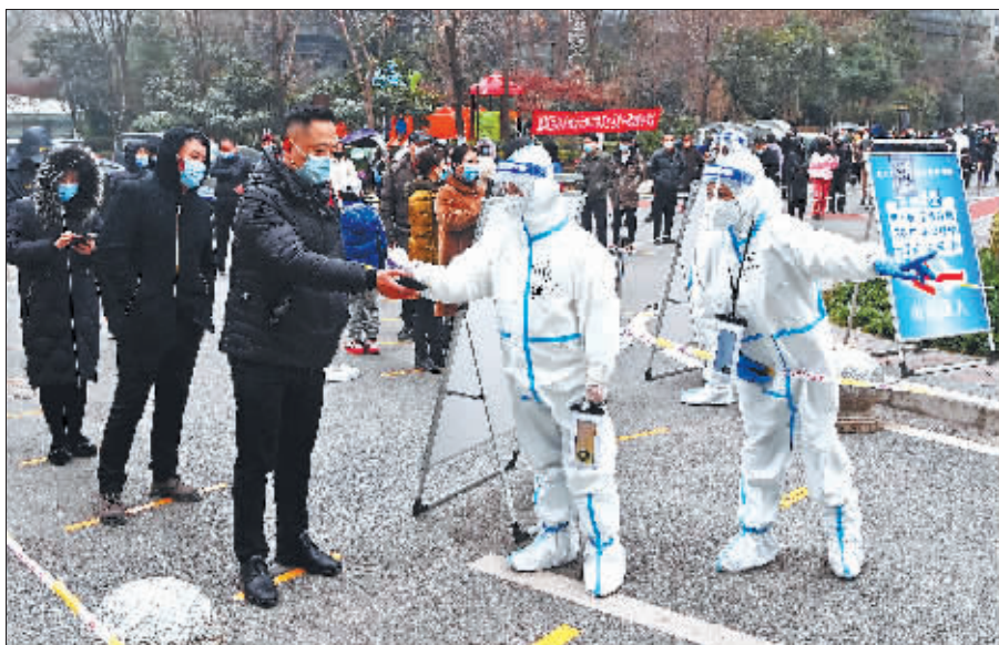
23日,西安市新城区一小区,住户排队接受新一轮核酸检测。

陕西省举行的新闻发布会介绍,截至22日,西安市全市停课学校3574所(其中中职39所,高中146所,初中301所,小学1190所,幼儿园1898所),停课人数209.8万人(其中涉及学生178.71万人)。各地根据疫情发展情况启动线上教学,用好国家中小学网络云平台和省、市、县教育资源服务平台,采取“一地一策”“一校一策”的方式,科学制定线上教学和管理方案,组织实施在线教育教学,做好辅导答疑等工作。