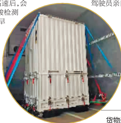
货物装箱，减震措施做足。

从事特种设备运输的驾驶员都是精挑细选的，他们有20万公里以上的驾驶经验。“驾驶员基本不需要导航，因为看导航分散精力。”工作人员说，他们常年在外，对路况太熟悉了，不仅是行走在高速公路上的活地图，驾驶技术也过硬。