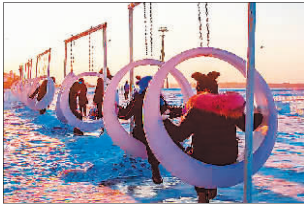
松花江上的冰雪嘉年华,夕阳给秋千涂上了一层粉色。