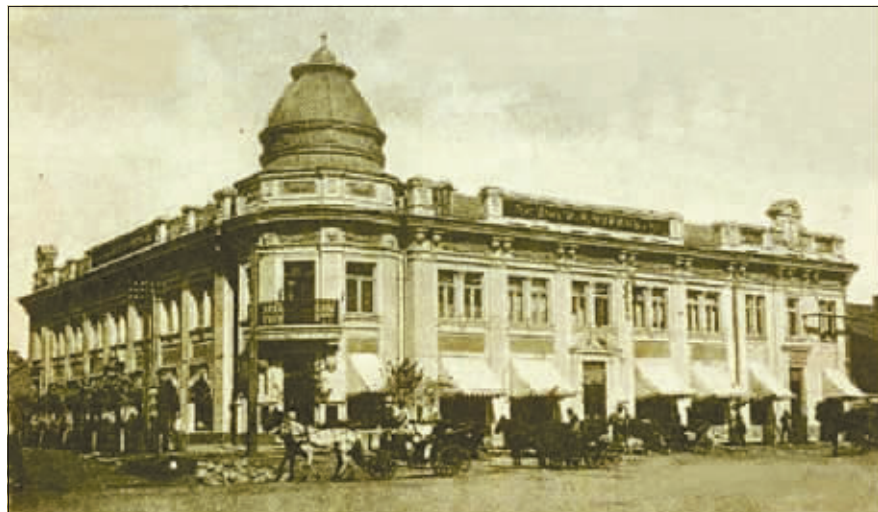
1908年刚刚落成的秋林洋行。

红肠、大列巴等传统食品，早已印刻在哈尔滨人的味蕾中，这不仅是秋林食品的象征，更是哈尔滨这座城市的名片。然而，百余年前，由秋林洋行茶庄自产自销的秋林红茶却鲜为人知。秋林红茶曾远销至中东铁路沿线各地及俄罗斯各城市。在其经营的半个世纪里，为中国茶的输出与销售，做出了时代贡献。