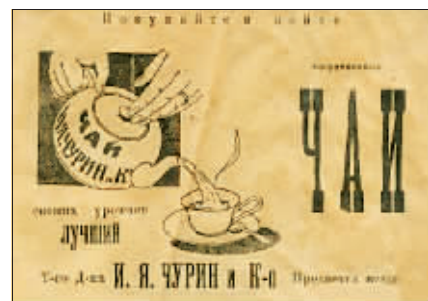
秋林洋行茶庄出品的俄文广告：新鲜茶叶在任何地方都可以买到。

提高了质量。这些工厂沿用欧洲的传统技术工艺，使用中国地产原料制造的产品，质量堪与欧洲产品媲美，其多个自产商品曾多次获得当时在法兰克福、布鲁塞尔、伦敦、巴黎、伯力等城市举办的展览会及中东铁路出口展览会优质产品金质奖章。包括茶叶等众多主打产品久负盛名，广泛地赢得了国内外市场，获得了可观的巨大利润。