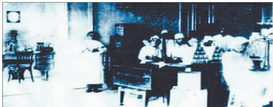
秋林洋行茶叶部的制作车间。