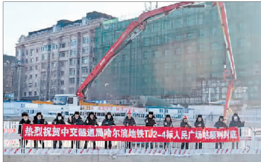
人民广场站顺利封底。

喷注浆、钢支撑衬垫系统等先进技术,专业人员每天深入一线指挥作战,坑内采用疏干井22口,出水量30m 3 /h的泵单并全天候进行排水,为车站的安全施工提供了有力保障。