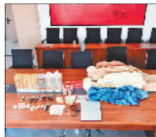
缴获的部分赃物。

“在世纪花园B栋发现嫌疑人踪迹。”“在世茂大道发现嫌疑人轨迹。”一条条线索渐渐汇聚到专案组。经过侦查员们4天3夜的不懈努力,终于锁