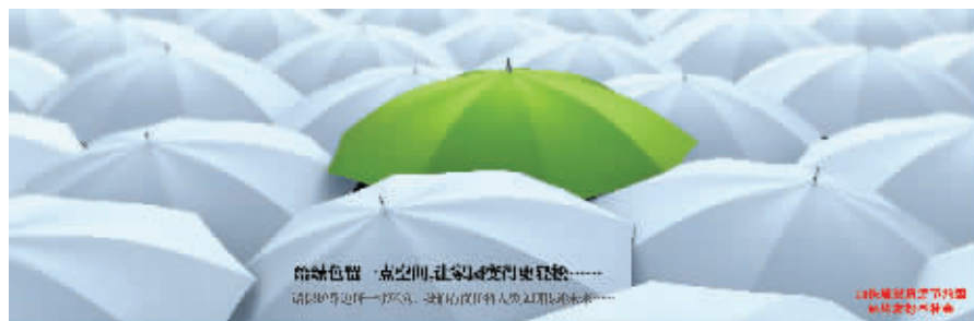
给绿色留一点空间，让冬日变得更轻松……