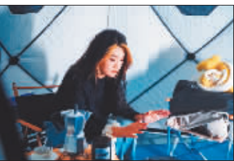
游客在帐篷中享受露营生活。