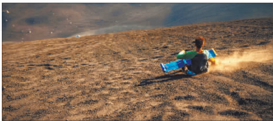
游人进行火山滑板运动。