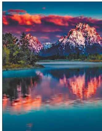
位于尼加拉瓜西南部的尼加拉瓜湖。

第安部落首领尼加拉奥,当初该部落的居民居住在湖边。当地人多年来一直保持着自然崇拜的习俗,喜欢将各种自然现象赋予神秘的意义。据称,尼加拉瓜境内每一座火山和湖泊都有一段传说。莫莫通博火山就被当地居民奉为“诸神居住的灵山”,是尼加拉奥酋长的化身,保佑着后代子孙的幸福。莫莫通博火山曾在1609年剧烈喷发,在上世纪初有过轻微喷发,近些年也喷发过,火山顶至今常年冒烟。出海的渔民很远便可根据其烟柱判断方位,所以莫莫通博火山又被称作“太平洋上的灯塔”。