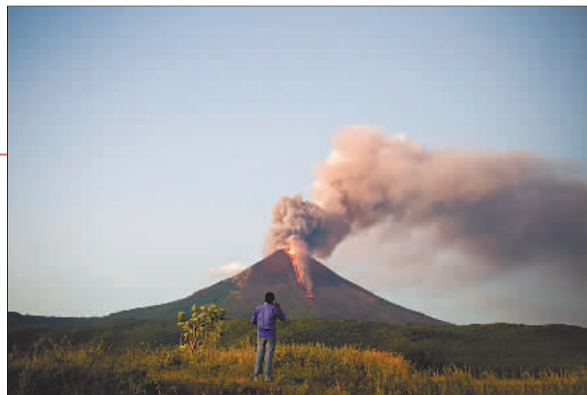
尼加拉瓜莫莫通博火山喷发时火山灰直冲云霄。

玛莎雅火山距离首都马那瓜只有不到20公里远,其周边方圆50多平方公里内的火山群和洼地被开辟为尼加拉瓜最早也是最