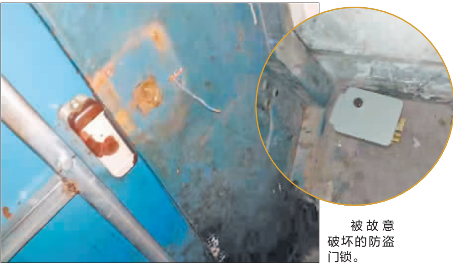
被故意破坏的防盗门锁。

本报讯(记者 黄晏君 文/摄)近日,家住香坊区旭升街179号乐民小区2栋5单元的部分居民向本报记者反映,该单元防盗门锁多次被人为破坏,居民们非常不安。