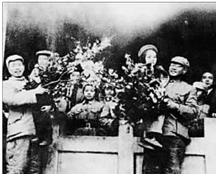
1950年初，云南人民欢迎四兵团进入昆明。左为宋任穷，前右为陈赓。

1956年，宋任穷出任第三机械工业部部长，主要负责我国原子能事业的建设和发展工作。仅有小学文化的