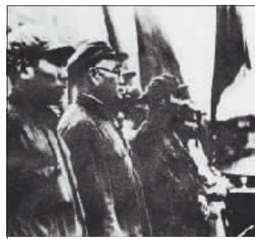
1949年10月在南京，宋任穷（左一）和刘伯承（左二）在一起。

苏联单方面撕毁关于援助中国研制核武器的协定之后，宋任穷带领团队开始白手起家，克服各种困难，较快地实现了自力更生的大转变，致力于建立中国自己的核科研基地和工业体系，大力开展科研工作，着重培养科技人才，为中国国防工业和核工业的发展作出了重大贡献。1964年10月16日，我国制造的第一颗原子弹在新疆罗布泊爆炸成功，比中央的要求提前了三年。宋任穷饱含激动的泪水给毛主席打电话：成功了，我们的原子弹爆炸成功了！正是第一颗原子弹的成功爆炸，让外国人对中国科研事业刮目相看。