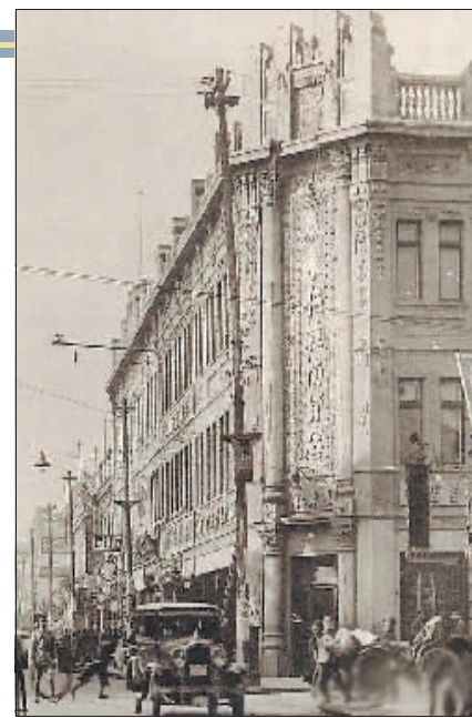
20世纪30年代的泰来仁鞋帽店。

从20世纪50年代起，其店址相继为中成鞋帽店、福祥鞋帽店。到了20世纪80年代为哈尔滨向阳毛皮商店。2000