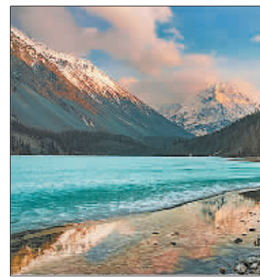
巴尔喀什湖因湖水一半是咸水一半是淡水而独具特色。

辗转于哈萨克斯坦的多个个城市，笔者对生态城市有了新认识：哈萨克斯坦的城市整洁、干净，到处都是鲜花、绿草、蓝天和绿树，城市生态保护很好，且富有文化品位，市民大都很有礼貌、谦和善良。城市处处有精美的雕塑，大都以哈萨克斯坦历史上的著名人物、事件以及民族的追求和希望为主题，从中可以感受到这个民族珍视历史，崇尚和平、自由的精神。