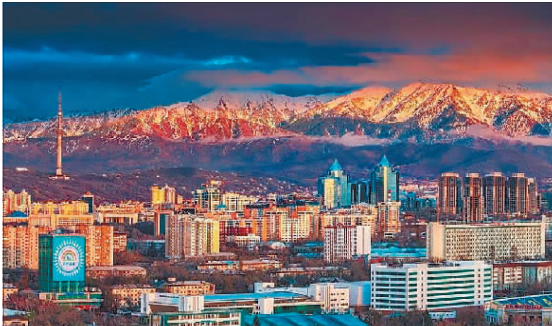
哈萨克斯坦最大城市阿拉木图。

萨克斯坦的旅游资源以自然景观为主。哈萨克斯坦南部地区最著名的旅游景点是恰伦大峡谷，它在阿拉木图以东约120公里，因地质变化而形成，像是上苍在草原腹地上撕开的一道狭长的裂缝，堪与美国的科罗拉多大峡谷媲美，其中最美丽的一段峡谷，由于风霜雨雪长年累月的侵蚀，峡谷中的山峰都变得形态奇特、怪石嶙峋。有的像昂首挺胸的公鸡，有的像神秘的城堡，有的像一只临风的蝴蝶，有的像奔驰的骏马……这里的每一块巨石都有一个古老的传说。手握扶栏，缓缓走下谷底，两侧山崖壁立，谷内遍布怪石和危岩。红黄色巨石和崖面上，岁月和风霜雨雪留下了斑驳痕迹。