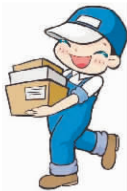
新晚报制图 宋占晨