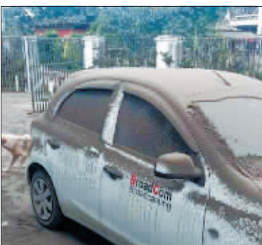
汽车被火山灰覆盖。

综合新华社、中央电视台报道 19日,汤加首都努库阿洛法开始恢复部分供电和通信。中国政府紧急驰援,已率先向汤加提供首批应急救援物资。