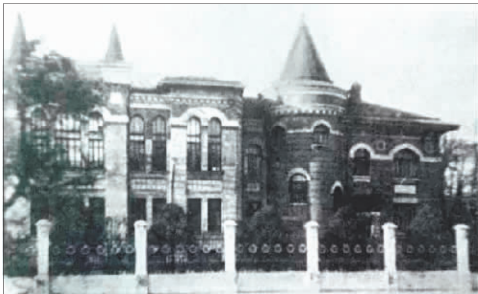
20世纪20年代的中东铁路哈尔滨电话局大楼。

中东铁路哈尔滨电话局大楼是一栋别具特色的建筑，虽然为扩大容量先后两次扩建，但该建筑始终以歌德式建筑风格为主调，体现出浓厚的浪漫主义倾向。建筑专家称，该建筑为仿中世纪古堡式建筑，砖混结构，外墙面