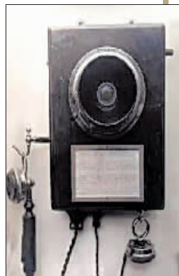
壁挂式磁石电话机

哈尔滨的电信事业是随着中东铁路的修建而兴起的，说起来距今已有120多年的历史了，哈尔滨第一个城市电话局的建立，奠定了哈尔滨电信事业的基础。值得庆幸的是，这栋电话局大楼在城市大规模改造建设之中被完好地保留了下来，为人们更好地了解哈尔滨这座城市的电话事业发展史，提供了可以触摸到的实证，这是极其难得的。