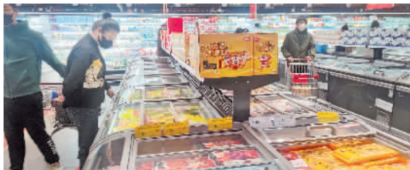
消费者在超市选购元宵。

今年您家会把什么口味的元宵端上餐桌?记者购买了27种口味的元宵,并于今明两天面向全城随机招募50位“美食品鉴官”,我们将给每位送出两袋元宵(汤圆),快来报名吧。