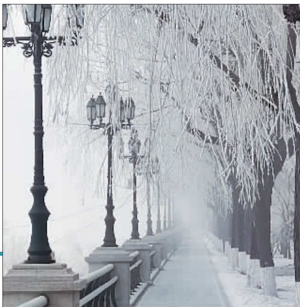
10日,雾凇美景在江畔惊艳亮相。