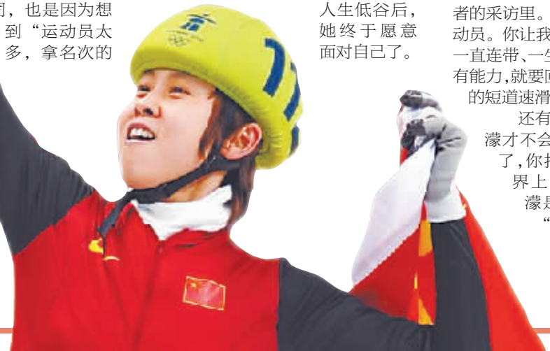
曾经的短道“大魔王”。

还有，她说：“只有短道速滑好，王濛才不会被人遗忘。短道速滑不好了，你打下的江山没了，在这个世界上，再也不会有人记得你王濛是冠军。”那时记者问她：“如果时间可以倒流，你最想回到自己的哪一个时刻？”她没犹豫：“2010年温哥华冬奥会，我刚刚比完赛之后。”