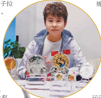
曾经的短道“大魔王”。

她也承认“以前拿冠军飘了”，从“中国短道速滑里程碑”变成了一个“反面教材”。在深陷那段漫长，充满委屈、气愤与悔意的人生低谷后，她终于愿意面对自己了。