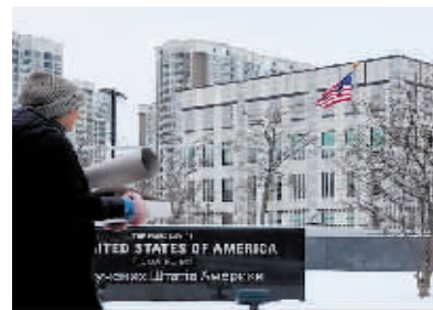
14日,美国发表声明说,暂时关闭驻乌克兰大使馆。

美国约翰斯·霍普金斯大学国际问题高级研究院教授哈尔·布兰兹11日在美国彭博社网站撰文指出,一旦欧洲大陆发生战争,其烈度之大、伤亡之重都是当今大多数欧洲人已久未经历的。战争将制造大量难民并进一步破坏欧洲稳定。