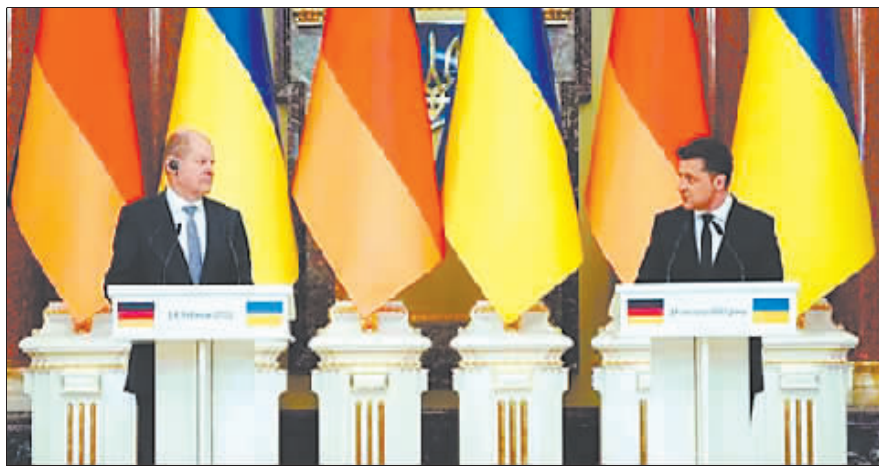
14日,德国总理朔尔茨和乌克兰总统泽连斯基举行会谈,双方均表示希望通过外交手段缓和乌克兰危机。