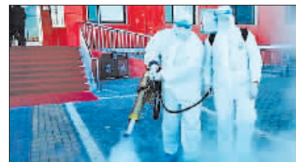
满洲里市进行灭毒消杀。

例的密接人员及其女儿,已经闭环转运至无锡市定点医疗机构隔离治疗。经市级专家组会诊,诊断为无症状感染者。