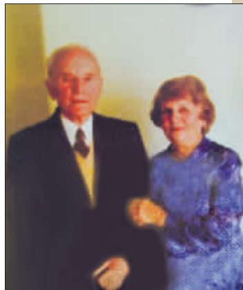
▲20世纪80年代巴吉赤和妻子在澳大利亚。