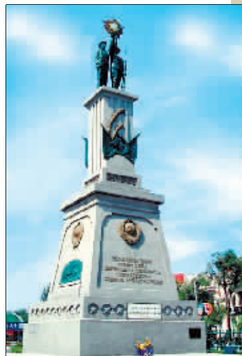
▲苏联红军烈士纪念馆。