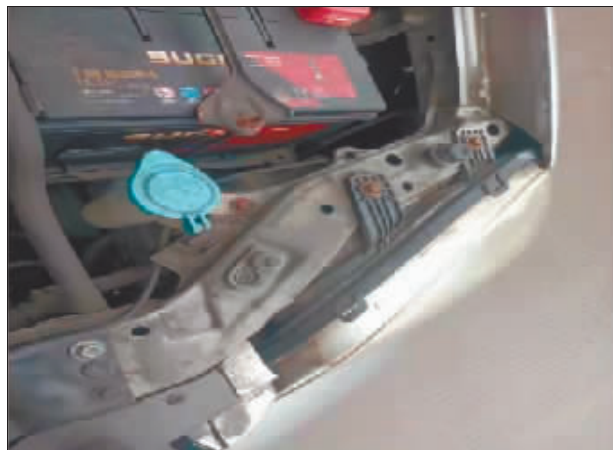
左前大灯框架检测出变形、钣金修复。