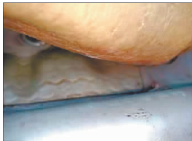
底板隔音胶及封边胶检测出有积水。