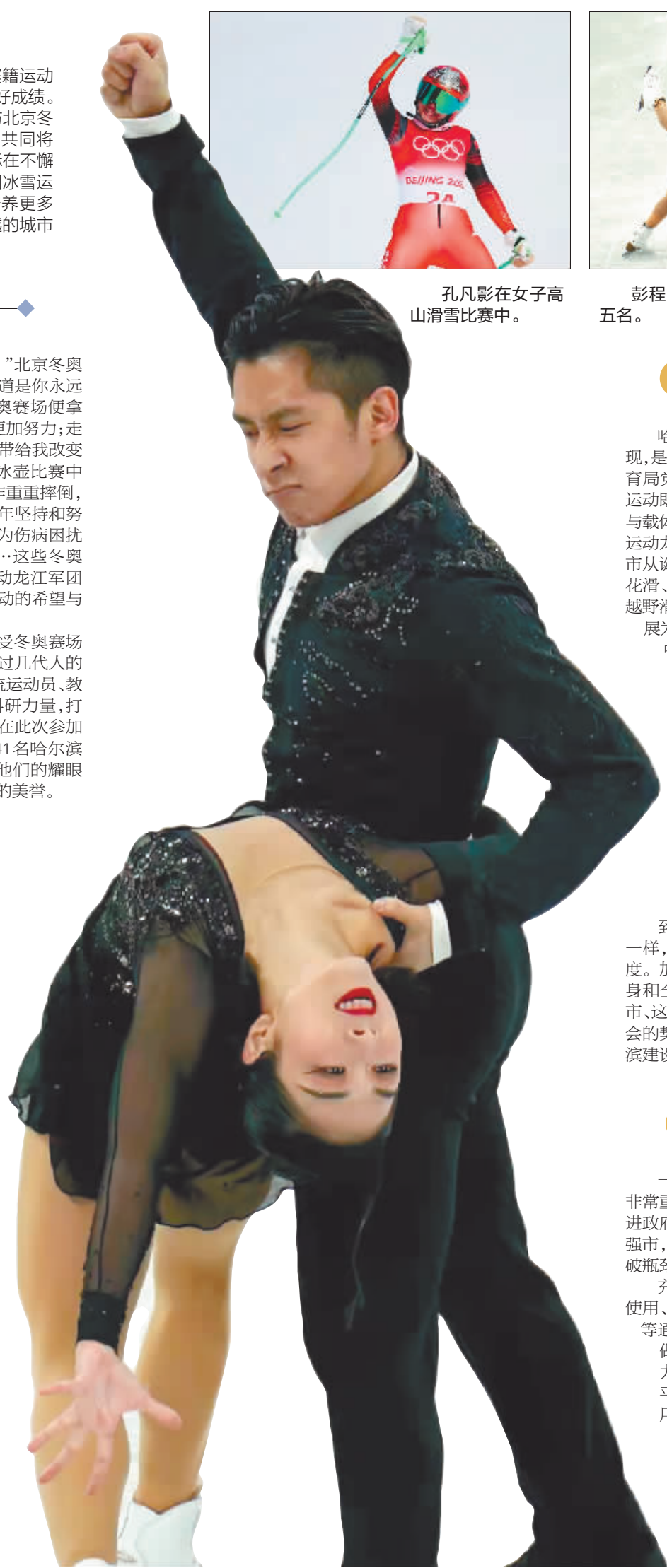
隋文静/韩聪获得北京冬奥会花样滑冰双人滑比赛金牌。