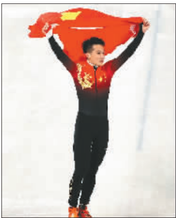
在短道速滑男子1000米决赛中，任子威获得金牌。