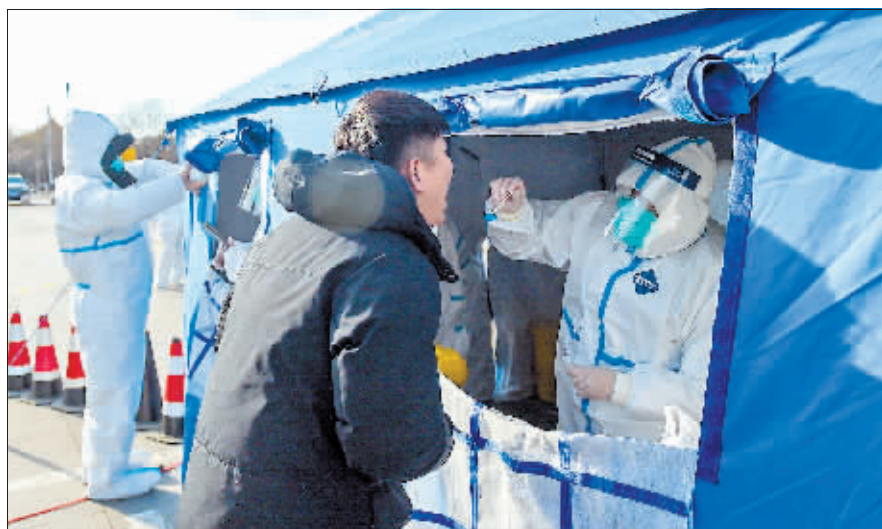
呼和浩特市玉泉区的居民接受核酸采样。

记者从呼和浩特市新冠肺炎疫情防控工作新闻发布会上获悉,截至2月21日14时,呼和浩特市本轮疫情累计报告本土新冠肺炎确诊病例168例,经专家会诊,57例为普通型、105例为轻型、5例为重症、1例为危重症。本轮疫情目前已累计排查出