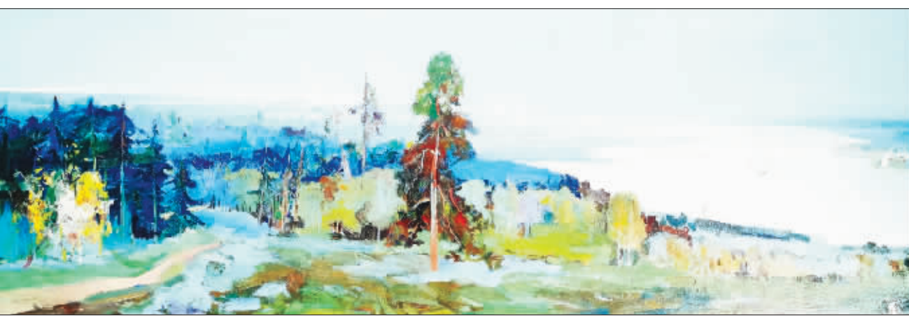
油画《北国之春》局部