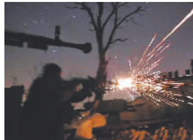
在乌克兰顿涅茨克地区，乌军士兵与民间武装作战。