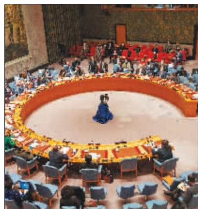
21日，在联合国总部，安理会举行审议乌克兰问题紧急会议。