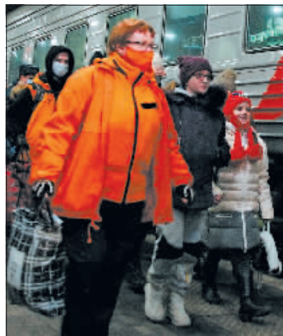
22日，来自乌克兰东部的难民乘火车抵达俄罗斯下诺夫哥罗德。

令，就俄罗斯承认乌克兰东部“顿涅茨克人民共和国”和“卢甘斯克人民共和国”的“主权和独立国家地位”一事作出回应，要求禁止美国人在这两个地区开展新的商贸活动。