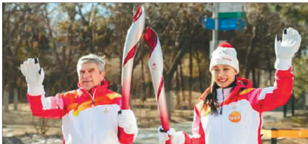
张虹(右)与国际奥委会主席巴赫完成火炬接力。

刘松说,这些都是祖国强大、国运强盛的表现。“一方面,优秀的运动员离不开国家的培养和科技团队的扶持。另一方面,安全舒适的场地、平整卓越的赛道方能助力运动员突破自我,发挥出最佳水平。中国不但在这两个方面做到了极致,而且还创新性地建成了冬奥史上首个与工业遗产再利用直接结合的竞赛场馆,突出了中国传统文化、工业文化和奥运文化的有机融合。”