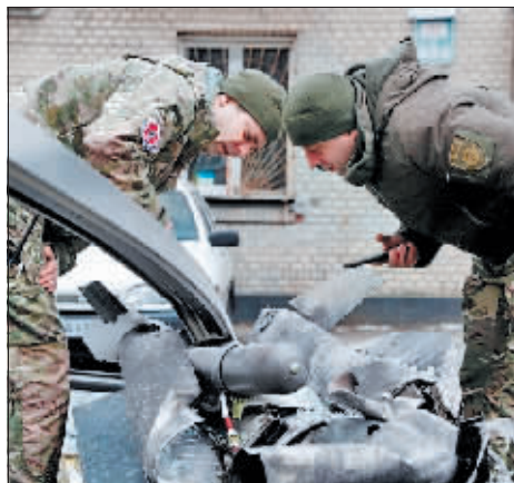
24日,在乌克兰首都基辅,警察检查落在街道上的导弹残骸。

北约秘书长斯托尔滕贝格24日说,北约无意向乌克兰派遣部队,但已启动联盟防御计划,并敦促俄罗斯立即停止在乌克兰的军事行动。美国白宫新闻秘书普萨基23日重申,美国不会与俄罗斯交战,也不会向乌克兰境内部署军队。