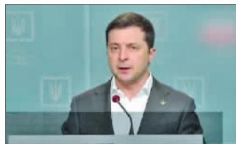
泽连斯基发表电视讲话。

24日,乌克兰总统泽连斯基发表全国讲话说,“俄罗斯向我们的军事设施和边境防卫人员发动攻击”,乌克兰全境实施战时状态,决定与俄罗斯断绝外交关系。