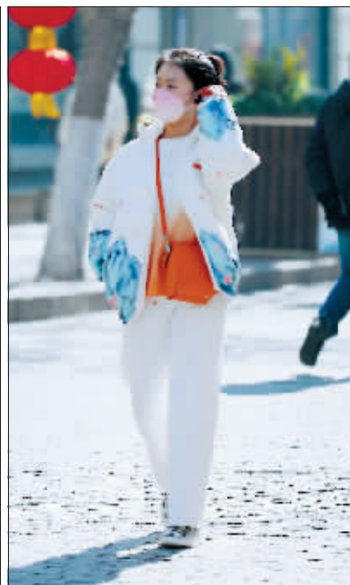
暖阳下,不少年轻人换上春装。