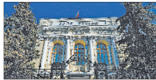
这是2月25日拍摄的俄罗斯中央银行。

此前一天,美国总统拜登还说,部分欧洲国家尚未准备好禁止俄方使用SWIFT系统。西方阵营内部之所以犹豫,是因为这张“牌”打出去,损害的不仅仅是俄方利益。