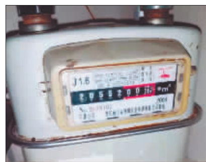
用户私自更换的燃气表。