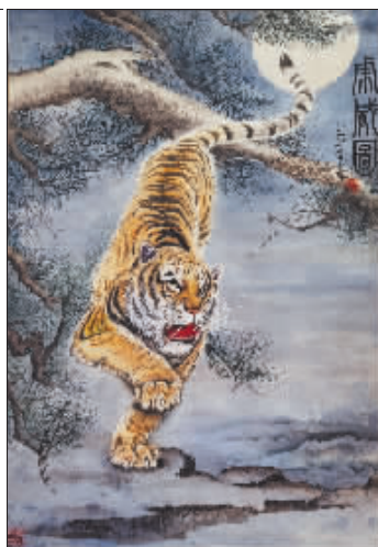
书法 作者 王菁婉