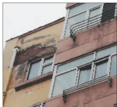
10号楼外墙部分水泥已经脱落,露出红砖,暗藏隐患。

截至14日18时记者发稿前,仍没有接到锦家物业公司的相关反馈,记者将对此事继续关注。