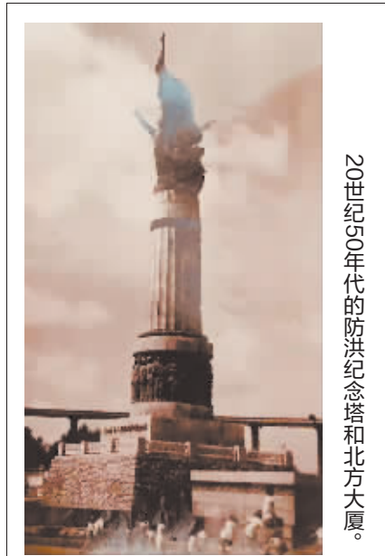
20世纪50年代的防洪纪念塔和北方大厦。