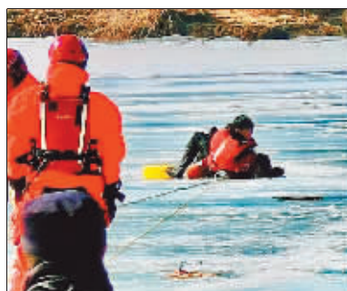
3月11日救援江上遇险者。