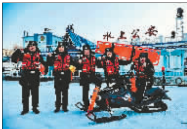
江上救护打捞大队。

曾在全国游泳锦标赛、公安部水警冬泳联赛、全国救生锦标赛、全国公开水域游泳分站赛、世界警察和消防员运动会、国际冬泳邀请赛、国际国内铁人三项赛等多项国内国际大赛中获得冠军……金玺