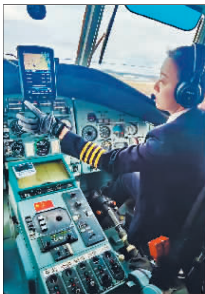
飞上蓝天英姿飒爽。