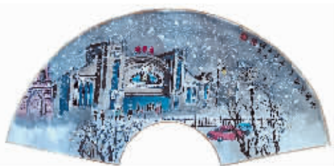
国画《哈尔滨北站》作者 李传民