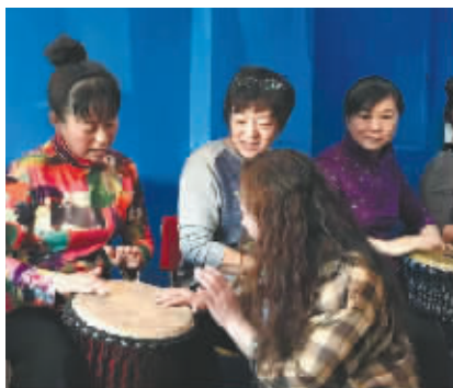
洛老师在指导学员打鼓手法。