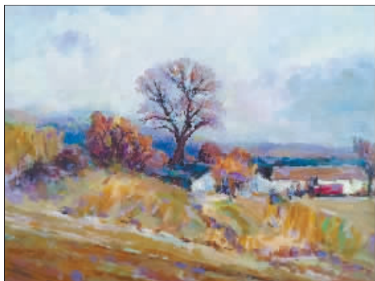
油画《松北秋日》作者 聂振达