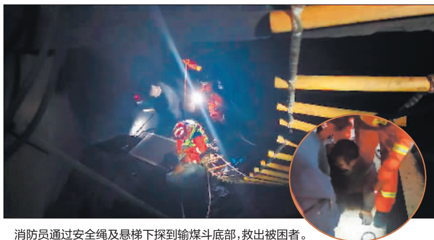
消防员通过安全绳及悬梯下探到输煤斗底部,救出被困者。

到被困人员膝盖处。此时为防止粉末煤发生倾倒,救援人员使用安全绳先将被困人员左腿固定,在输煤斗外部救援人员协助下将被困人员左腿拔出,又用同样方式将被困者右腿固定并成功拔出。