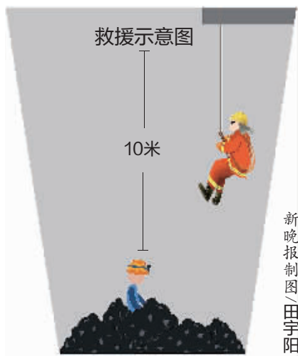
新晚报制图/田宇阳

名救援人员利用挡板对被困人员周围流动粉末煤进行阻挡,另一名救援人员使用铁锹和铁锹,采取边挖掘、边清理、边观察、边解救的方式展开救援。