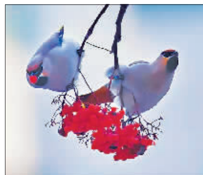
小区枝头上的太平鸟。

这群“小精灵”的到来,为这个小区增添了一抹不一样的春日色彩,居民们都说,小区的环境越来越美了,日子一天比一天好,这不,太平鸟都爱上了咱的家园。为了让这群“小精灵”留下来,居民们没少费心思,光投食点就设置了好几处,大米、小米、玉米全都放了,小朋友还拿出了心爱的饼干,碾成碎屑来喂鸟。