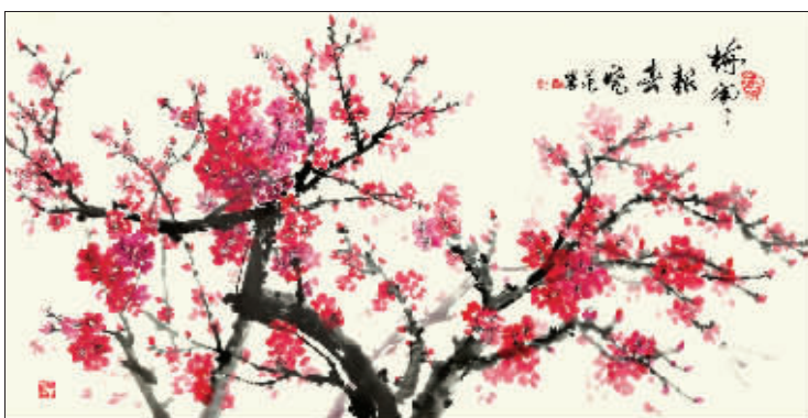
国画《梅开报春晓》 作者 范桂云

秀出书画佳作，分享诗歌、散文等，欢迎提供原创图文。文章字数在300-800字之间；书画图片大小在1M以上，并注明姓名及联系方式。作品请发至1372136484@qq.com。