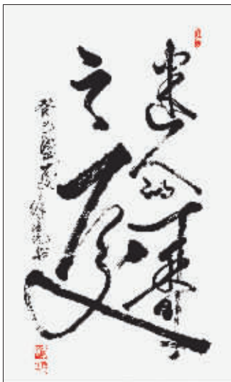
书法 迷人的丁香之夏 作者 徐德沅