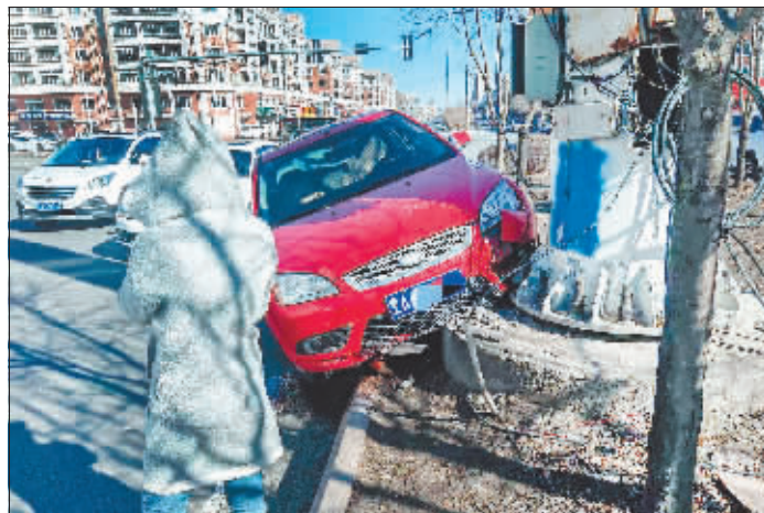
事故现场,红色轿车破损,洒了一地油。

本报讯(记者 王铁军/文)“这么高的道牙子,SUV上都挺费劲,更别说这么小的车了。这是怎么上去的呢?”12日早高峰,市民吴先生上班途中遇到一起单方交通事故,一辆红色的小轿车“骑”上路中间的隔离带,一头撞在通信铁塔底座,被撞“花脸”,好在车内驾驶员没有受伤。